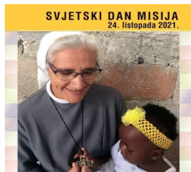
Ne možemo ne govoriti što vidjesmo i čusmo (10. A. 20)

Papinska misijska djela objavila su prigodne materijale - plakat i brošuru - u povodu Svjetskoga dana misija koji se obilježava u nedjelju 24. listopada pod geslom „Ne možemo ne govoriti o onome što vidjesmo i čusmo“ (Dj 4, 20).